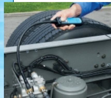
Circuits de freinage