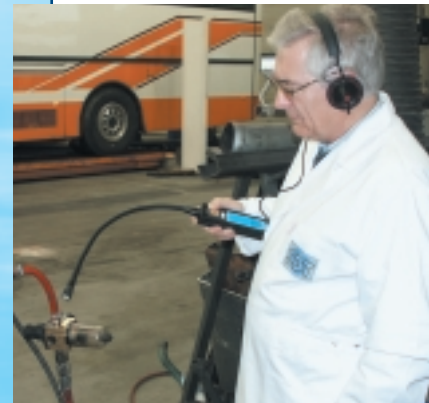
Air comprimé en atelier

Le FLEX.US ne se contente pas de vous signaler la présence de ces ultrasons, il vous permet de les écouter pour une localisation fiable et précise des fuites et défauts d'étanchéité.